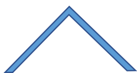
V-positie Beide kanten op

De volgende posities moeten allemaal minimaal 1x in de dans voorkomen in de categorie Teams: